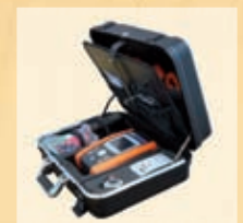
VA300 Robuster Geräteschutzkoffer