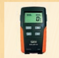
SOLAR-02 Externer Datenlogger