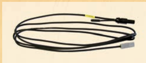
PT300N Temperaturfühler für die Solarzellen