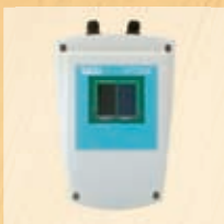
HT304 Duo Referenz-Zelle für Einstrahlungsmessung