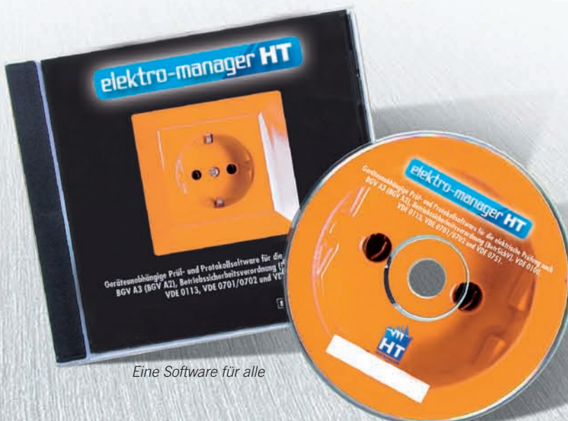
Eine Software für alle