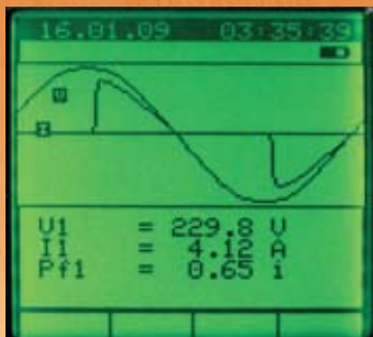
Wellenform von Spannung und Strom