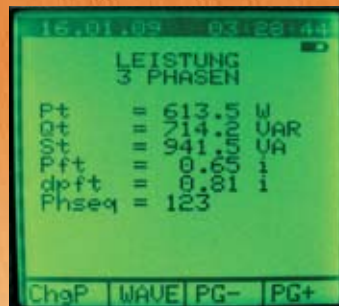
Leistungsdaten 3 Phasen System