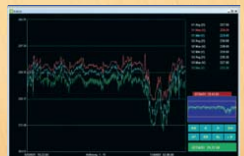
Grafische Darstellung der Messwerte