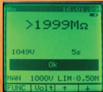
Isolationsmessung mit 1000 V DC